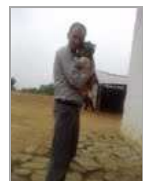
držať v ruke anjela je nádherné