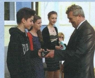
Starosta obce odmeňuje najlepších žiakov školy

Všetkým, ktorí sa podieľajú na dobrom mene školy, ďakujeme.