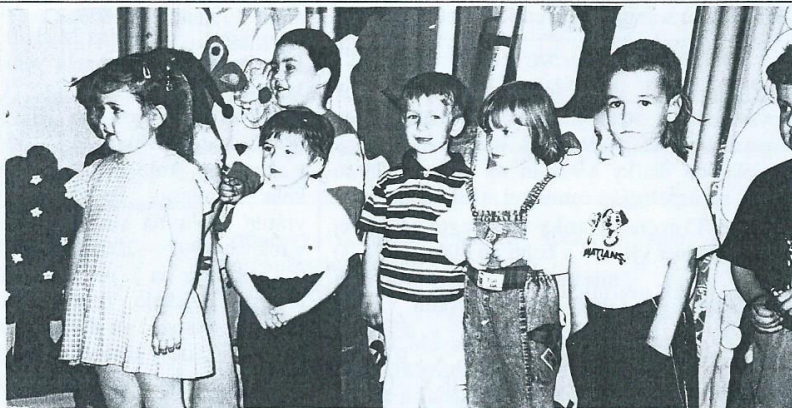
- záber je z kultúrneho vystúpenia detí MŠ-