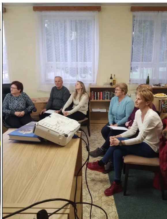
Kvíz o Cerovej