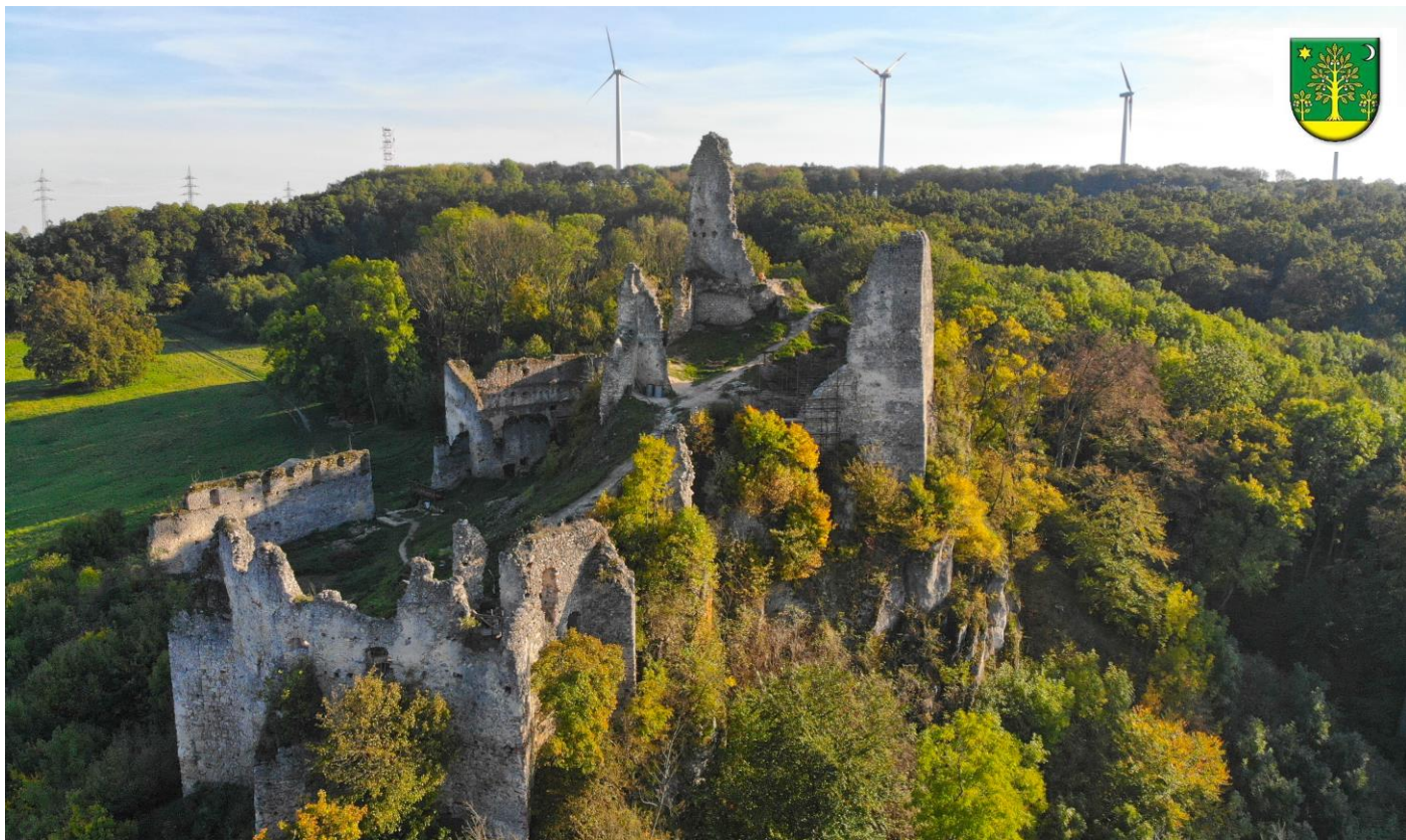
Korlátka z dronu.

Po krátkej odmlke sa vám opäť prihovárajú vaše Ceroviny. Prinášajú vám informácie o dianí v našej obci v uplynulých mesiacoch, zaujímavosti i pravidelné rubriky. Okrem nich zároveň kladú otázku, ako zapojiť viac ľudí nielen do podujatí obce, školy, knižnice a organizácií, ale i do diskusie, ako zlepšiť život v obci.