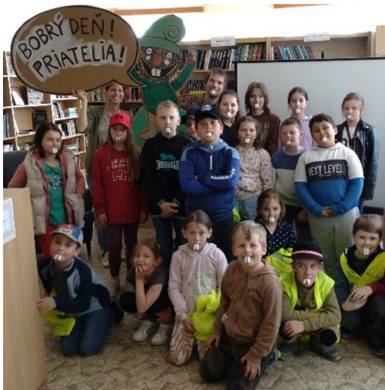
Foto - Prednáška o bobroch

Naša knižnica je už i na internete: https://k_cerova.biblib.sk/?fn=LibraryProfileChildYV86T&&seo=Kni%C5%BEnica-Cerov%C3%A1-InfoGate . Je tu aj online katalóg kníh.