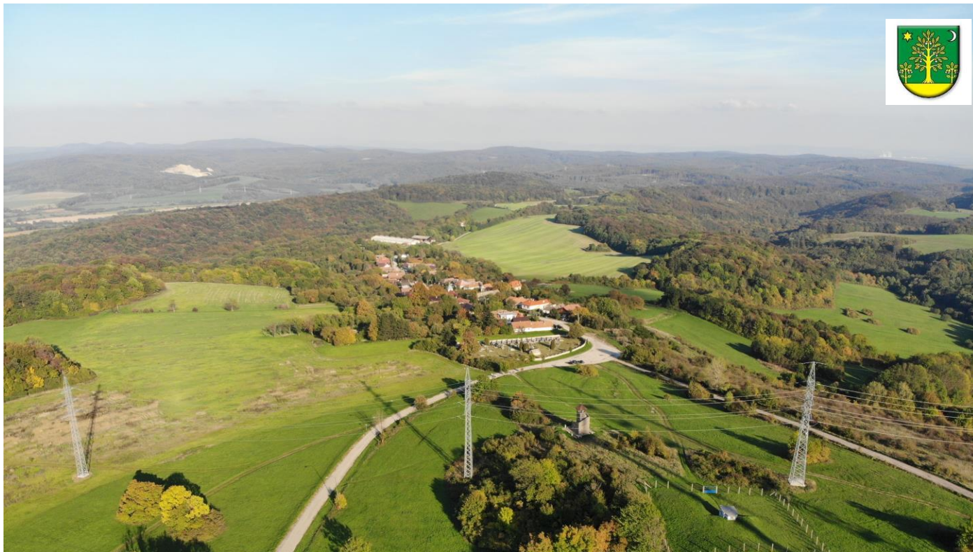
Rozbehy z dronu.