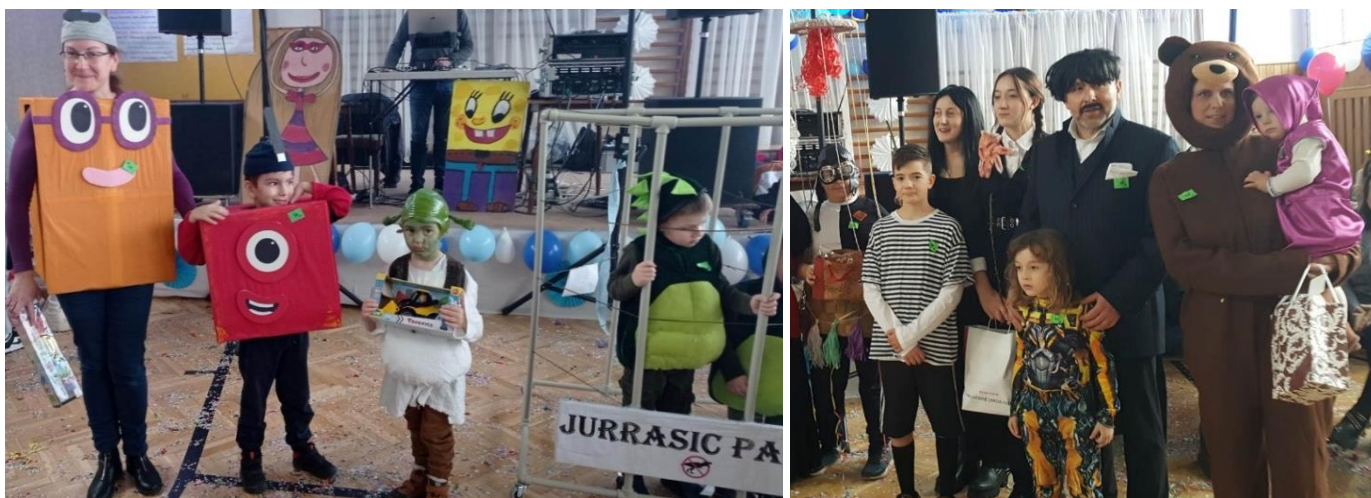
Karneval ↑ a Veľkonočné dielničky v škole.